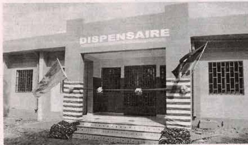
C'est désormais ce dispensaire qui prendra en charge les habitants de Sig-Nonghin et environnants