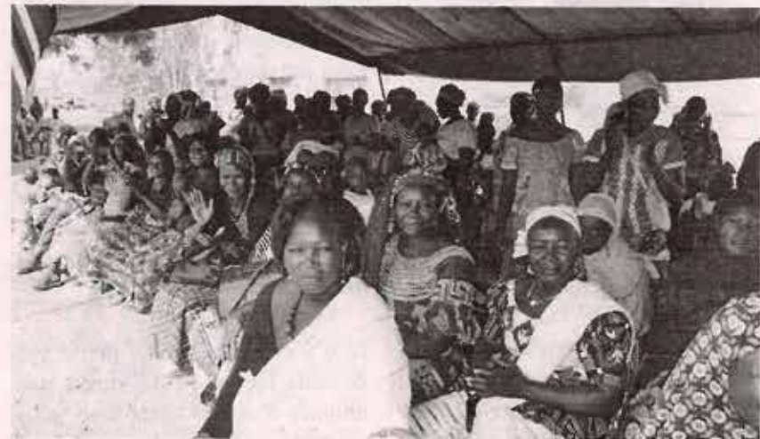
Chefs coutumiers et populations sont sortis massivement pour prendre part à l'inauguration