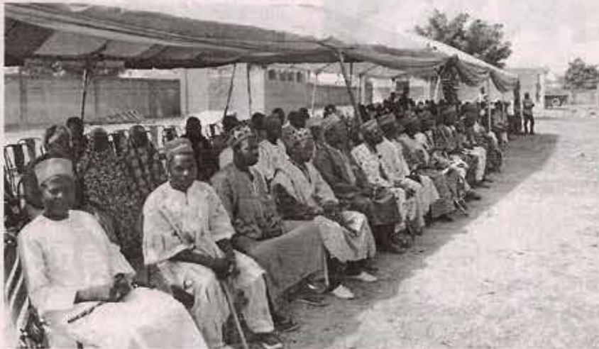
Ph. Lambert O.

Le mardi 8 novembre 2016, les populations de Sig-Nonghin, secteur 38, à l'arrondissement 9, ont assisté à l'inauguration d'un nouveau dispensaire, un don des partenaires allemands, amis du Moogh Naaba. La cérémonie a eu lieu dans les locaux du centre de santé.